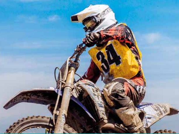
ARTICLES DE SPORT