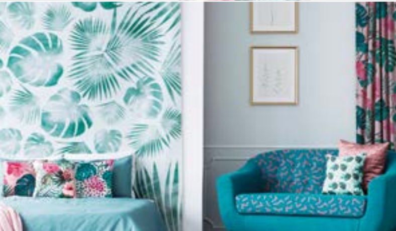
COMPLEMENTOS DEL HOGAR