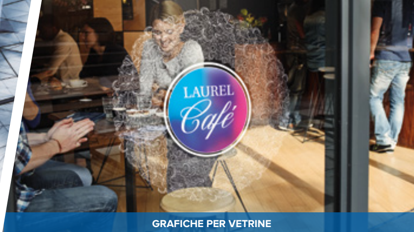
GRAFICHE PER VETRINE