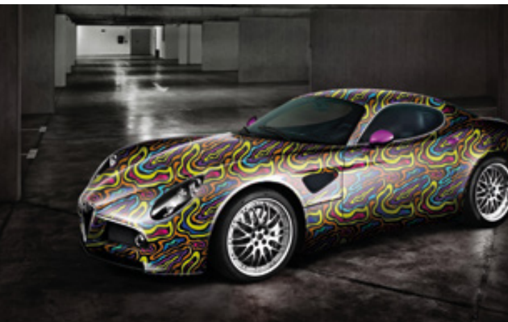
WRAPPING PER VEICOLI