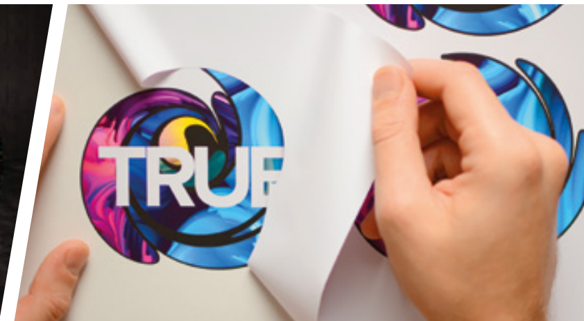
ETICHETTE E DECALCOMANIE FUSTELLATE