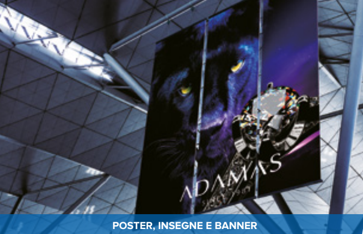
POSTER, INSEGNE E BANNER