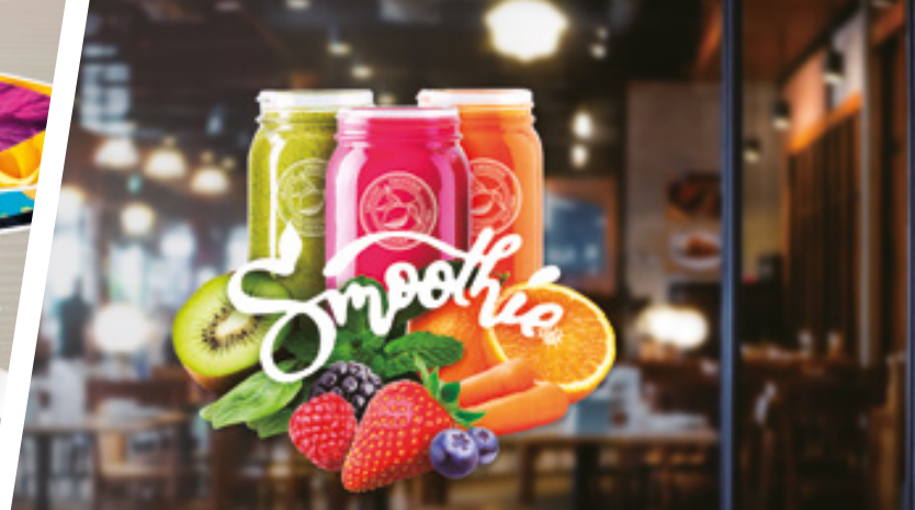
GRAFICHE PER VETRINE