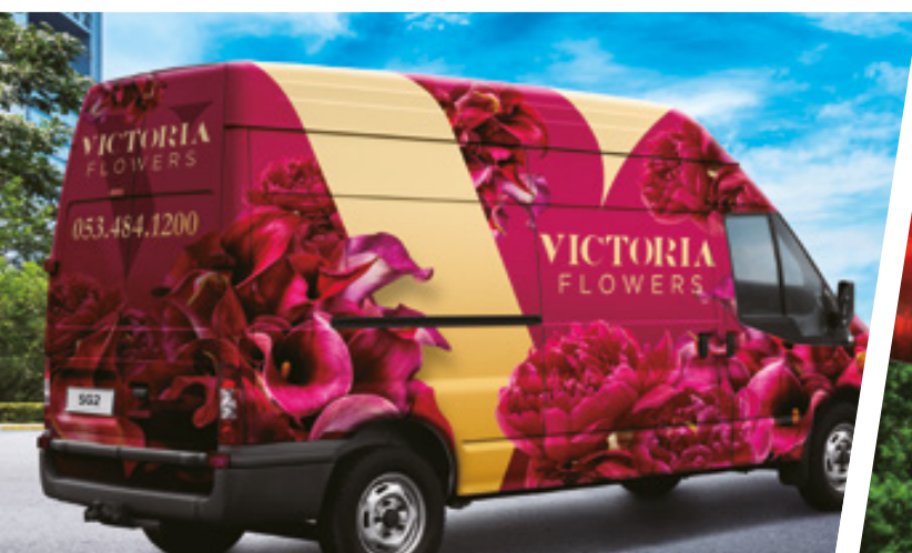
WRAPPING PER VEICOLI