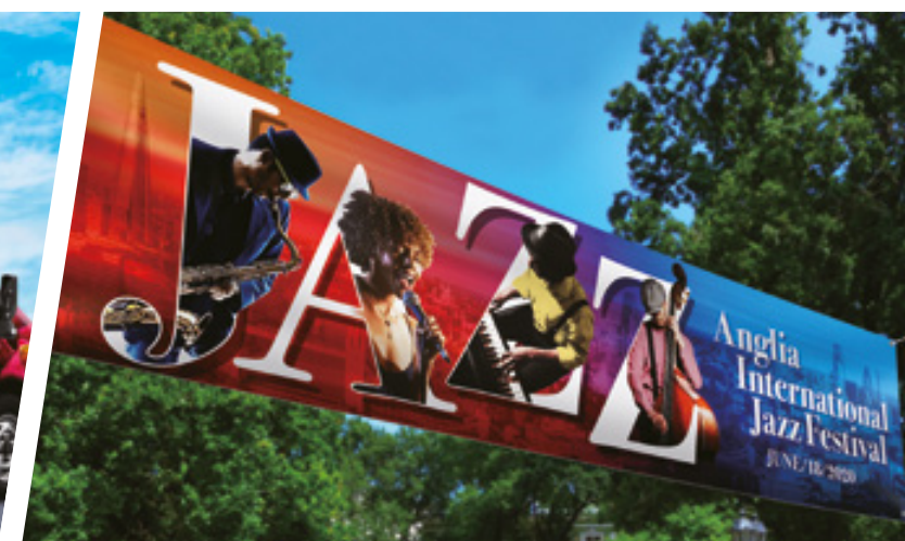
BANNER, INSEGNE E POSTER