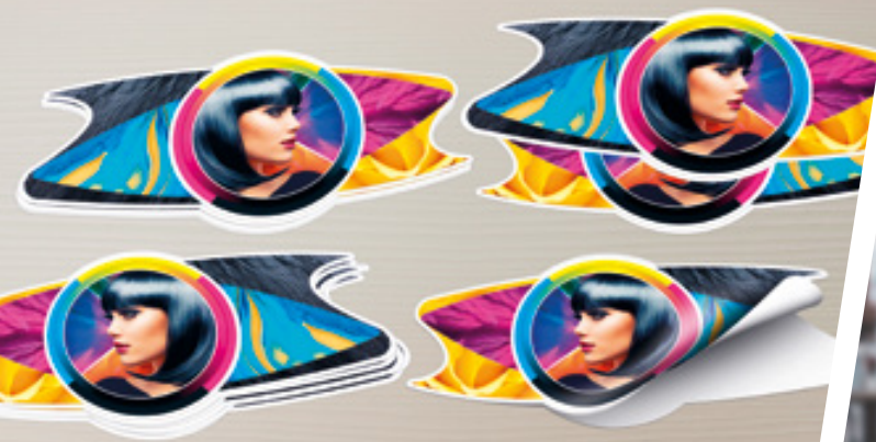
ETICHETTE E ADESIVI FUSTELLATI