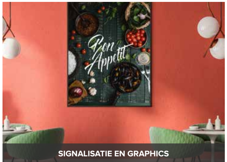
SIGNALISATIE EN GRAPHICS