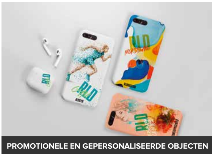
PROMOTIONELE EN GEPERSONALISEERDE OBJECTEN