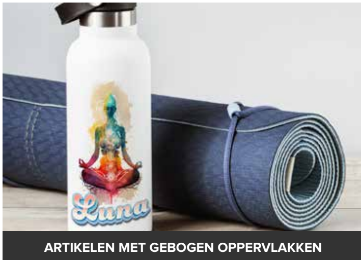
ARTIKELEN MET GEBOGEN OPPERVLAKKEN