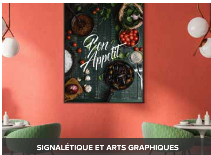
SIGNALÉTIQUE ET ARTS GRAPHIQUES