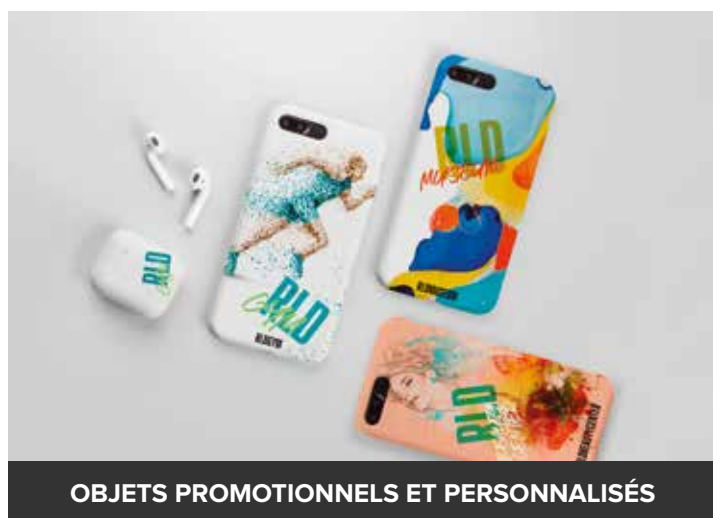
OBJETS PROMOTIONNELS ET PERSONNALISÉS