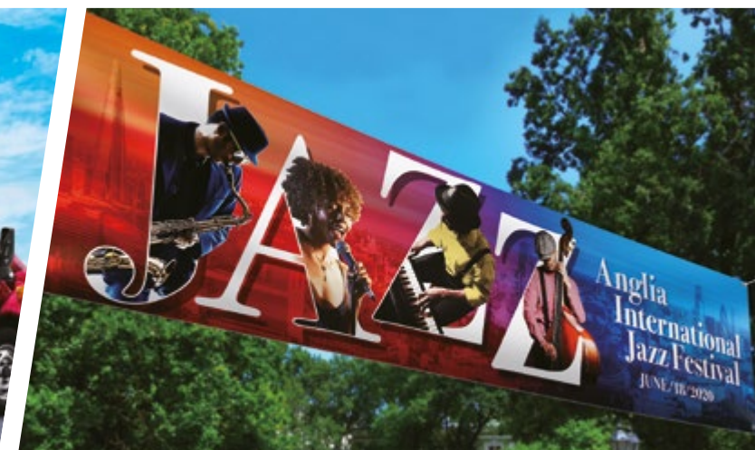
BANNERS, BORDEN EN POSTERS