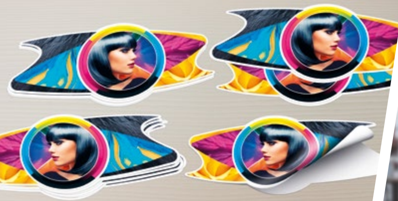
GESTANSTE LABELS EN STICKERS