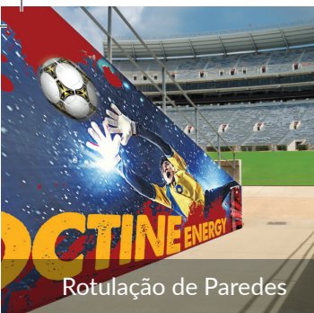
Rotulação de Paredes