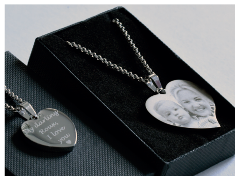
Gioielli e ciondoli