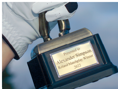
Incisione di trofei