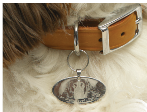
Medagliette per cani