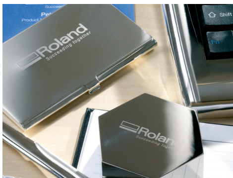
Cancelleria con marchio

Puoi sistemare tutto il necessario per la tua attività su una scrivania da ufficio o sul tavolo della cucina e creare le basi per costruire qualcosa di più grande in futuro.