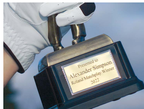
Gravação de troféus