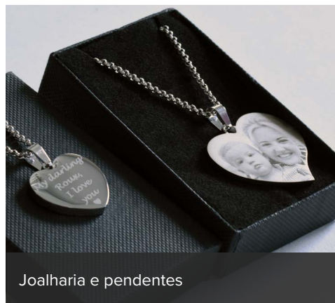
Joalharia e pendentos