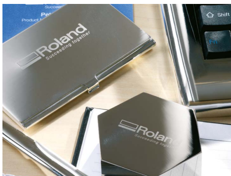
Produtos de papelaria com marca

Pode ter todo o seu negócio numa única secretária ou mesa de cozinha e criar as bases para construir algo ainda maior no futuro.