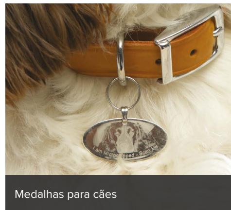
Medalhas para cães