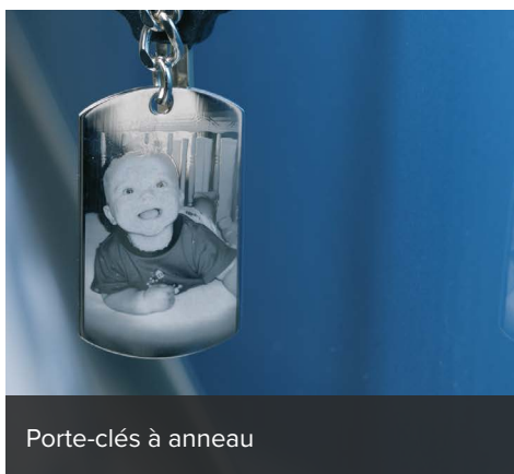
Porte-clés à anneau