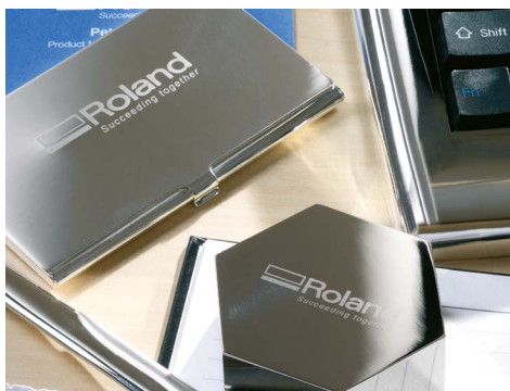
Schreibwaren mit Markenzeichen

Sie können Ihr gesamtes Unternehmen auf einem Büro- oder Küchentisch unterbringen und damit die Grundlage für zukünftige, noch größere Projekte schaffen.