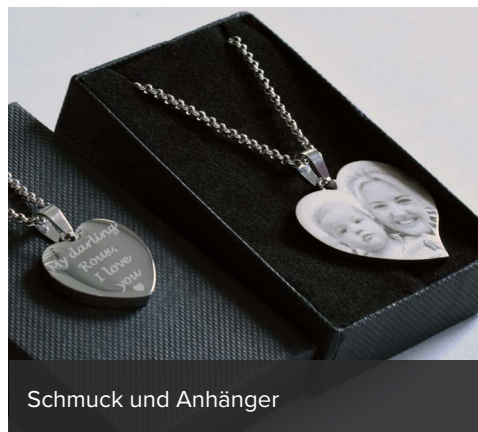
Schmuck und Anhänger