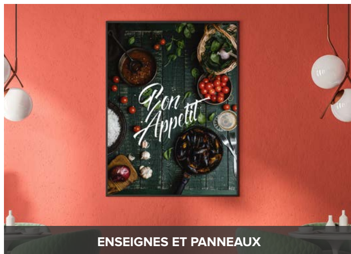
ENSEIGNES ET PANNEAUX