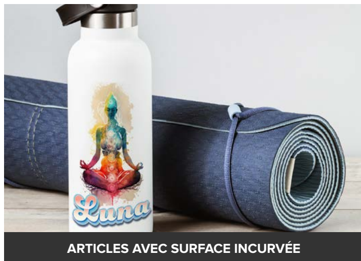
ARTICLES AVEC SURFACE INCURVÉE