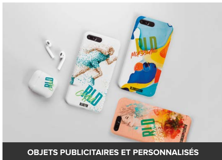
OBJETS PUBLICITAIRES ET PERSONNALISÉS