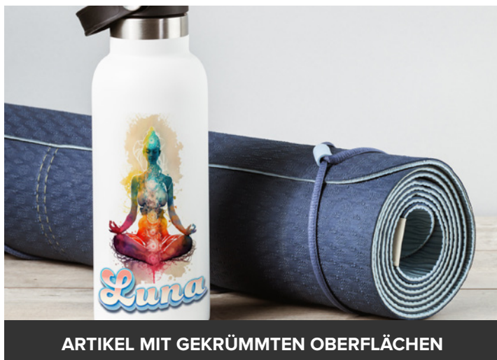
ARTIKEL MIT GEKRÜMMTEN OBERFLÄCHEN