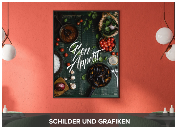
SCHILDER UND GRAFIKEN