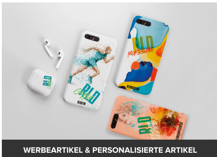
WERBEARTIKEL & PERSONALISIERTE ARTIKEL