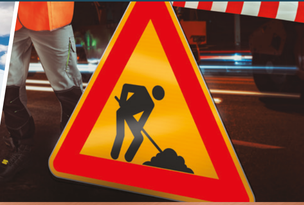
ÇOK YÖNLÜ TABELA