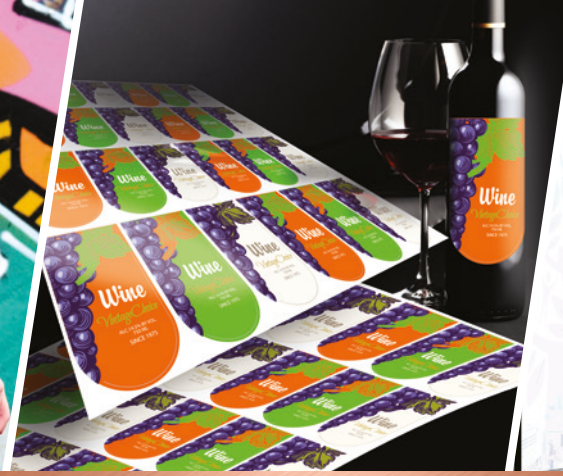
KONTUR KESME ETİKETLERİ