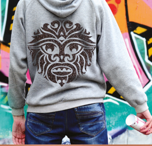
ISI TRANSFERİ GİYİMİ