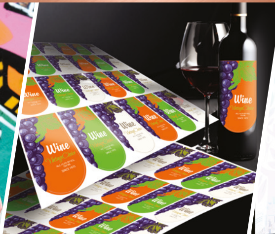
KONTURSCHNEIDEN FÜR ETIKETTEN