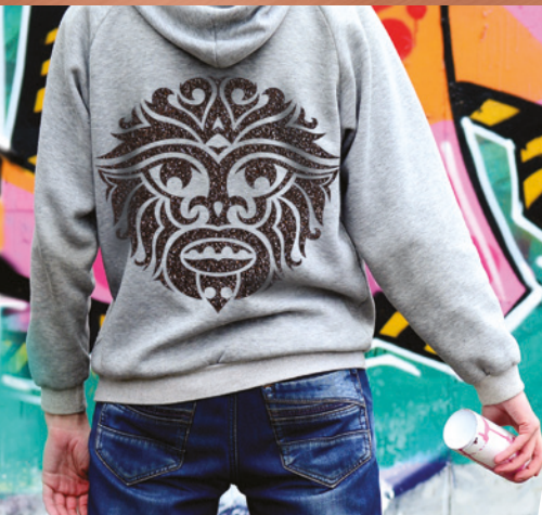
THERMOTRANSFERS FÜR BEKLEIDUNG