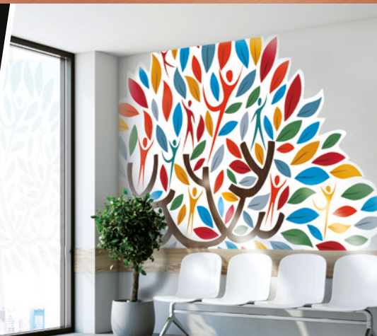
FENSTER- UND WANDGRAFIKEN