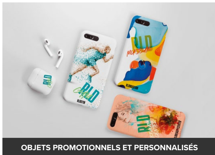
OBJETS PROMOTIONNELS ET PERSONNALISÉS