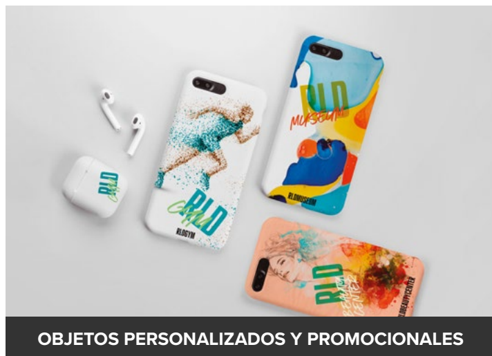
OBJETOS PERSONALIZADOS Y PROMOCIONALES