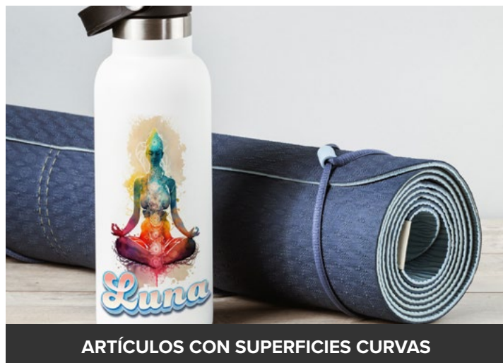
ARTÍCULOS CON SUPERFICIES CURVAS