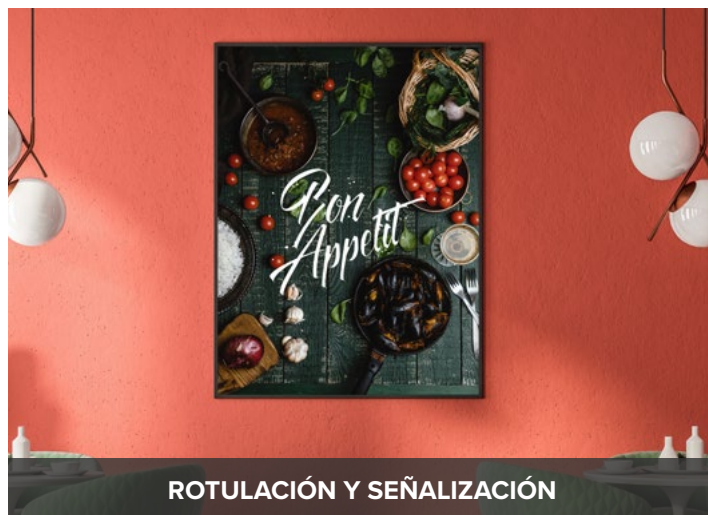
ROTULACIÓN Y SEÑALIZACIÓN