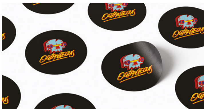
ЭТИКЕТКИ, ВЫРЕЗАННЫЕ ПО КОНТУРУ