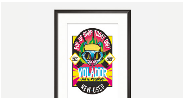
ВЫВЕСКИ И ПЛАКАТЫ