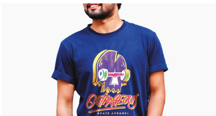
ОДЕЖДА С ТЕРМОТРАНСФЕРНОЙ ГРАФИКОЙ