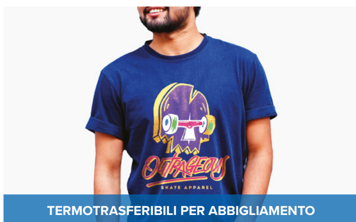
TERMOTRASFERIBILI PER ABBIGLIAMENTO