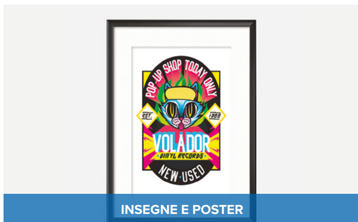
INSEGNE E POSTER